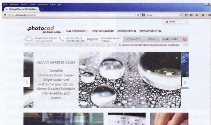
Der Online-Shop bietet den Kunden die Möglichkeit, unter anderem SMD-Schablonen genau für ihre Bedürfnisse zu konfigurieren